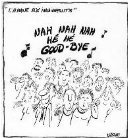
L'Hymne aux immigrants, dessin caricature de Jean-Marc Phaneuf. 11 mars 1987.

© Bibliothèque et Archives nationales du Québec / P575,S4,SS4,P308