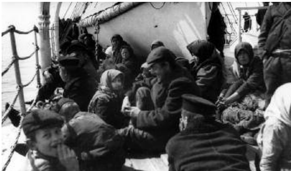
Groupe de réfugiés ou d'immigrants sur un bateau, 1907-1914.