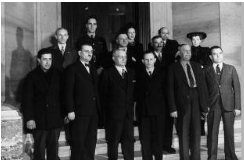
Premiers immigrants recevant la citoyenneté canadienne plutôt que britannique, 1947.