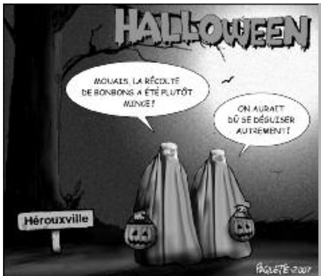
Caricature de Serge Paquette publiée dans La Voix de l'Est , le 30 octobre 2007.